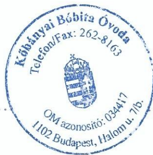
Blattner Edit intézményvezető