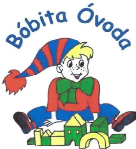
Blattner Edit óvodavezető

„Harmonikus Gyermekkorért” Óvodai Pedagógiai Program Kőbányai Bóbita Óvoda 1102 Budapest, Halom utca 7/b.